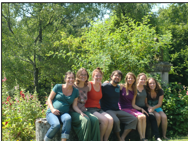
Integrantes del Comité de PBI Honduras, junto a voluntarios y voluntarias seleccionadas para formar parte del primer equipo en el terreno

En el segundo semestre de 2013 se realizó una semana de entrenamiento en Suiza, última etapa del proceso de formación del primer equipo de acompañantes internacionales. Las personas seleccionadas, de nacionalidad alemana, chilena, holandesa y suiza, cuentan con experiencia previa en un proyecto de PBI en la región de América Latina. Las dos primeras personas llegaron a Tegucigalpa en el mes de octubre de 2013 y en enero del 2014 se incorporaron las otras dos. Está previsto que el equipo actual, compuesto por estas cuatro personas, se mantenga durante buena parte del 2014.